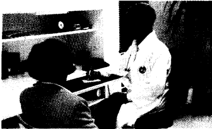
Die Hausärzte sympathisieren mit dem Arzneiversand. Was die Kosten reduziert, sei für Ärzte grundsätzlich interessant, so die Position des Hausärzteverbandes. Seite 8

9 50 Jahre NAI: Medienmacht wichtiger denn je