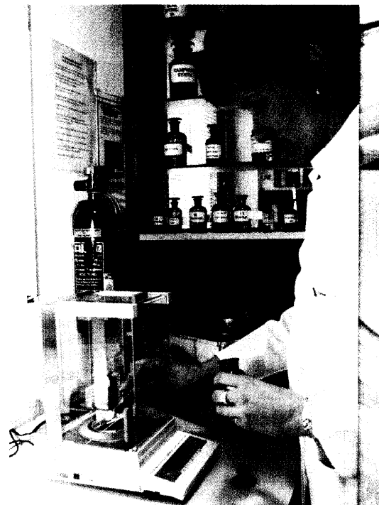
In einer Umfrage wollte die Apothekerkammer Westfalen-Lippe von ihren Mitgliedern wissen, wie viele Rezepturen sie innerhalb von 24 Tagen produzieren. Das Ergebnis kann sich sehen lassen: Maßgeschneiderte Medikamente aus der Apotheke sind sehr gefragt. Mehr ab Seite 16