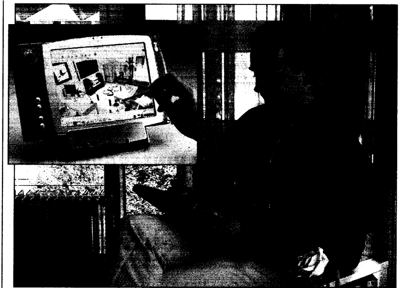
Patienten schicken Befunde der Wunddokumentation mit Hilfe eines Mini-

den Piloten signifikant erhöht, und zwar um das 2,2fache: Statt wie erwartet 38, erkrankten 84 der Piloten an Hautkrebs. Die Hautkrebs-Inzidenz hing dabei von der Zahl der Flugstunden ab: Bei den elf Prozent der Piloten, die mehr als 20 Millisievert an Strahlung aufgenommen hatten – dazu sind immerhin etwa 4000 Flugstunden