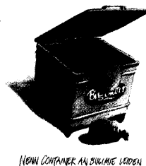
NON CONTAINER AN SWITZERLEND

Zeitkritik vom Feinsten. Die Ausstellung „Böse Zeiten! Cartoons von Bö, Gut & Chappatte“ im Karikatur & Cartoon Museum Basel präsentiert unter anderem Zeichnungen von Carl Böckli, einem der bedeutendsten Schweizer Karikaturisten des 20. Jahrhunderts (bis 3. November 2002). Mehr Kunst auf Seite 9.