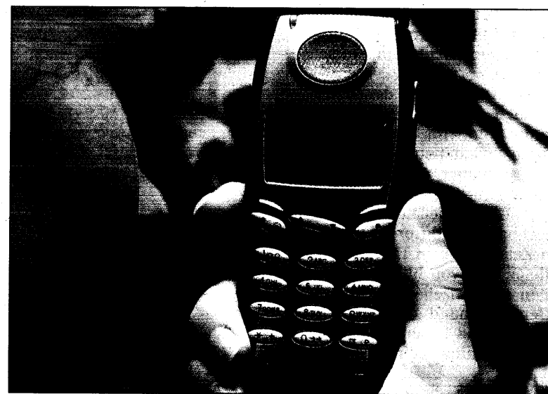
„Hast du schon deinen Spray genommen?“, heißt es in der SMS.

Streitpunkt sind die datenschutzrechtlichen Regelungen, auf