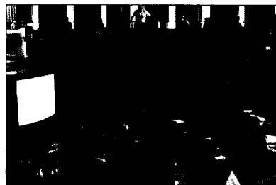
Knochenregeneration – der Stand der Wissenschaft

40 Knochenregeneration – der Stand der Wissenschaft ZÄ Doreen Jaeschke