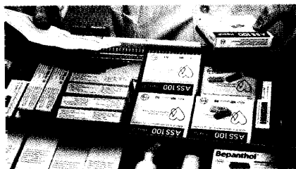
Die Generika-Hersteller erwarten, dass Aut idem den Markt dramatisch verändern wird. Ein Gutachten gibt ihnen Recht. Seite 8

Am Ende sind es fünf Pharmaunternehmen klagen