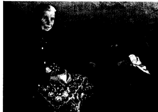
Seite 34 Die südrumäni- sche Provinz Giurgiu trifft die wirtschaft- liche Not besonders hart