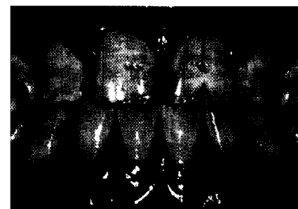
Schwere Dentalfluorose bei einem 14-jährigen Mädchen Seite 69