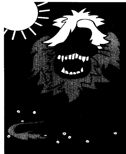
Aktion Löwenzahn Seite 66