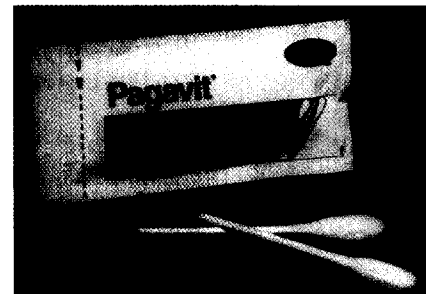
Pagavit®-Stäbchen Seite 17