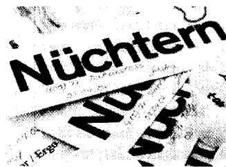
Seite 38 In der DRK-Klinik Mark Brandenburg versuchen Alkoholranke den Entzug