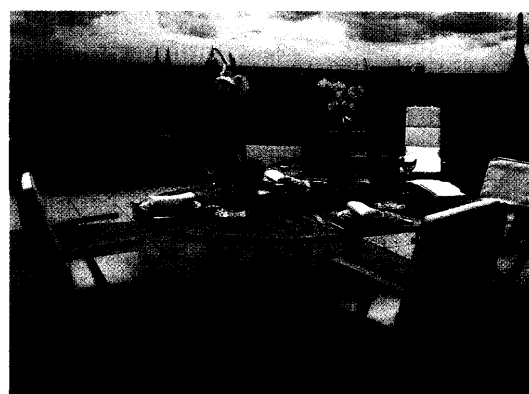
HOTEL MEURICE, Paris