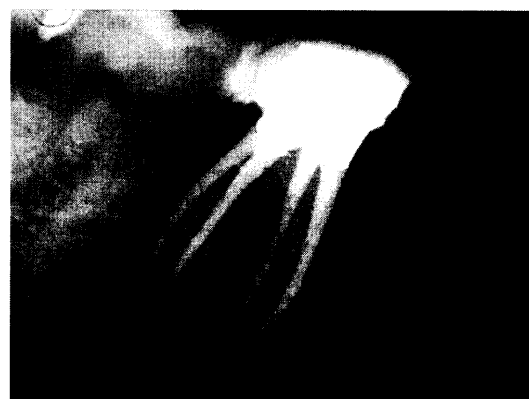
Endo hat Zukunft Bericht Seite 37