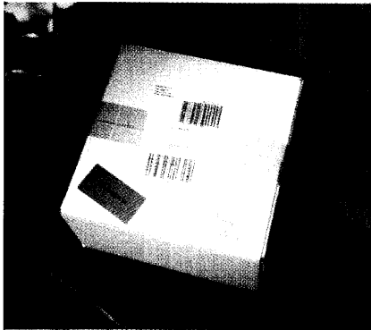
Lieferung bis vor die Haustür: Arzneimittelsicherheit definiert bei DocMorris der Postbote. Seite 8

Testkauf bei DocMorris: Nach 19 Tagen vor der Haustür