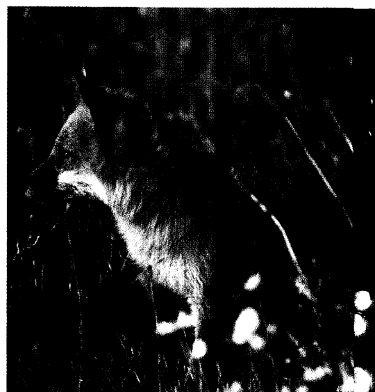
Füchse sind in hiesigen Breiten Hauptüberträger des Tollwutvirus auf andere Tiere. Impfprogramme haben das Virus in Deutschland jedoch stark dezimiert. In den strukturschwachen Ländern ist die Tollwut aber noch immer eine große Gefahr, vor allem für Kinder. Seite 30