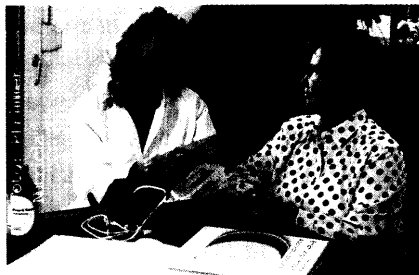
Eine eingehende Einweisung in den Umgang mit Ernährungssystemen ist unerlässlich

Integrierte Versorgung, Teil 1: Die Karten werden neu gemischt 27