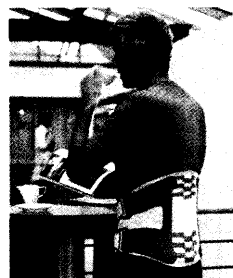
Auf sieben Seiten stellen wir Ihnen in 23 Kurzberichten neue Produkte vor