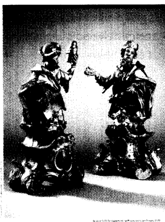
Dieser Ausgabe liegt das Supplement »Deutsches Apothekenmuseum 1/02« bei.