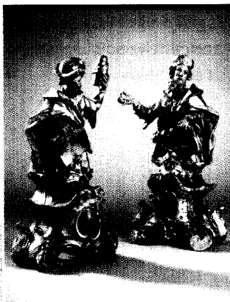
Dieser Ausgabe liegt das Supplement »Deutsches Apothekenmuseum 1/02« bei.