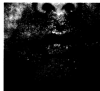
Initial kleinblasiger Impetigo contagiosa