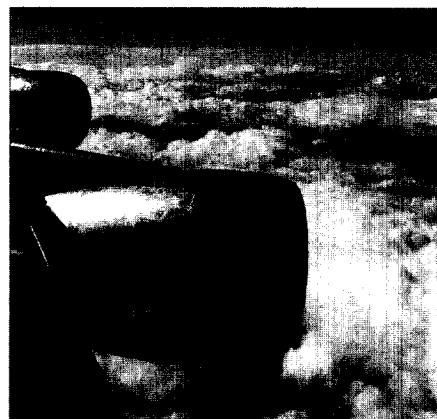
Nachtfluglärm verursacht Schlaflosigkeit und gesundheitliche Störungen.