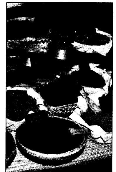
Bunt und gesund: Die Welt der...

07 ZEITUNGSBIBLIOTHEK ZEITUNGSKRÄFTESTELLE 091441 JOSEPH-STELZMANN-STR. 9 50931 KÖLN 2.539 1