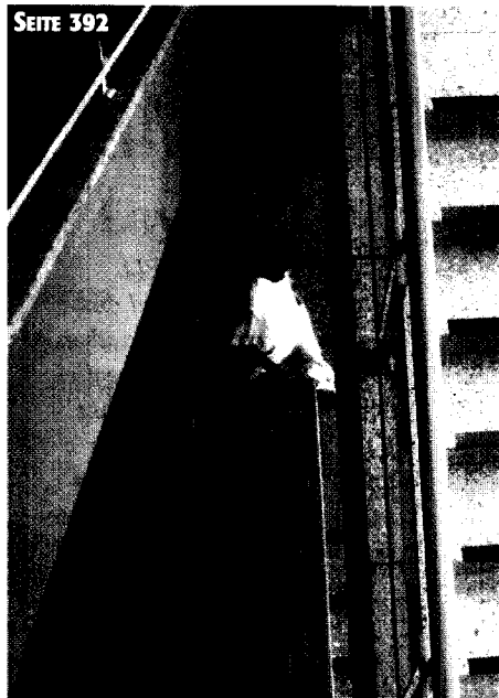
Flexible Arbeitszeiten können die Motivation der Mitarbeiter erhöhen

Die Evangelische Fachhochschule Berlin (EFB) entwickelt und plant die Implementierung eines dualen berufsintegrierten Studiengangs zum gleichzeitigen Erwerb eines ersten Hochschulgrades auf Bachelor-Niveau sowie eines berufsqualifizierenden Abschlusses in der Pflege auf der Grundlage des Krankenpflegegesetzes.