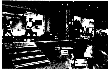
Orthesen von einer Tanz-Gruppe vorgeführt

Orthopädie + Reha-Technik: Die Reihen fest geschlossen 6 Bilder einer Ausstellung 10