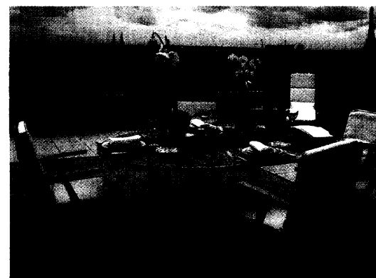
HOTEL MEURICE, Paris