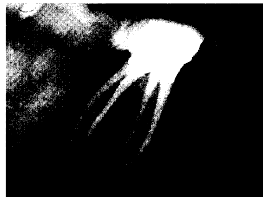
Endo hat Zukunft Bericht Seite 37