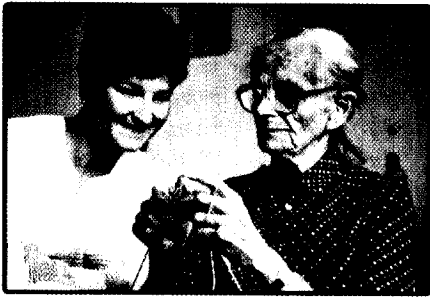
ZU UNSEREM TITELBILD:

Die psychosoziale Begleitung unterstützt den Prozess der Auseinandersetzung, um Patienten möglichst davor zu bewahren, in Resignation zu verfallen oder die Realität zu verleugnen.