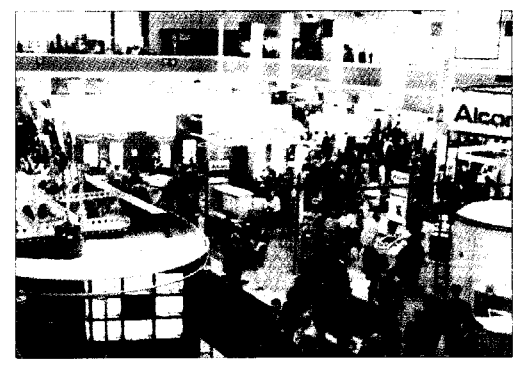
Dichtes Gedrängel auf der Industrieausstellung – bei Kongressen der Ophthalmochirurgen an der Tagesordnung.

Es sind gleich zwei internationale Kongressereignisse im Monat Juni, auf denen sich die internationale Ophthalmochirurgie präsentiert, und beide werden mutmaßlich neue Teilnehmerrekorde aufstellen. Vom 1. bis zum 5. Juni tagte in Philadelphia die American Society for Cataract and Refractive Surgery (ASCRS), die größte augenchirurgische Gesellschaft der Welt. Nur acht Tage später geht es nun in Nürnberg weiter: Auf der 15. Jahrestagung der Deutschen Ophthalmochirurgen (DOC) werden rund 3500 Augenärzte zu einem Kongress erwartet, der an Bedeutung der amerikanischen Tagung