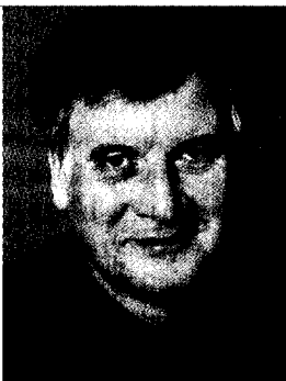
Horst Seehofer, Mitglied des Bundestages und ehemaliger Bundesgesundheitsminister

Weil ich hier übersichtlich neue Informationen über die verschiedenen medizinischen Gebiete und zu völlig unterschiedlichen Themen finden kann.