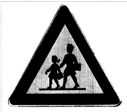
Nach dem Drama von Erfurt: Krisengebiet Schule