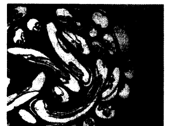
Histologie mit einem Konvolut von Onchocerca