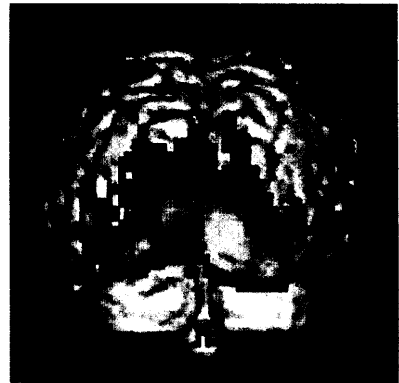
Aktivierung der Sehrinde nach optischer Reizung bei einem Gesunden im funktionellen MRT.

Interessiert sich ein geeigneter Patient für das Training, wird er