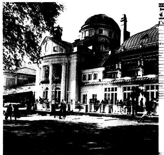
Fettstoffwechselstörungen und Augenerkrankungen standen im Mittelpunkt des 40. Pharmacons in Meran. Den Bericht vom Jubiläumskongress lesen Sie ab Seite 30.