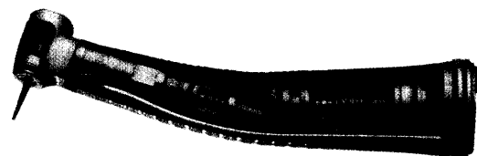
Zahnärztliche Instrumente Bericht Seite 21