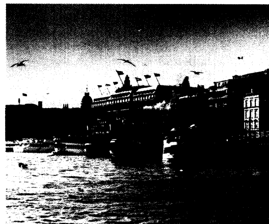
Grand Hotel Stockholm Bericht Seite 68