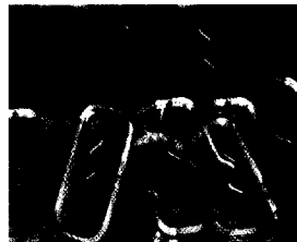
Zum Titelbild: siehe Beitrag auf Seite 212–26

Cited in/Gelistet in Index Medicus (Medline) • DIMDI