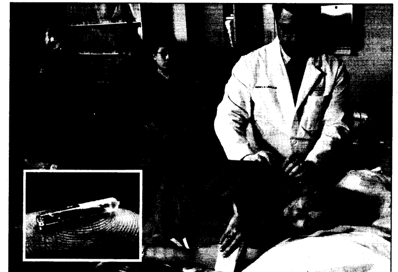
Die Implantation des reiskorngroßen VeriChips dauert nur eine Minute. Auf ihm sind Informationen über den Patienten gespeichert.