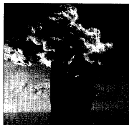
Fallstudie: Gesundheitszustand von Umweltpatienten verbessert sich nach Expositionsstopp.