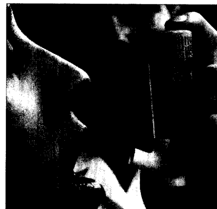
Patienten mit Asthma bronchiale sind häufig gegen Hausstaubmilben allergisch.