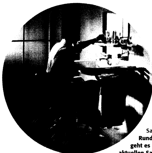
Sani-Special S. 38-56: Rund ums Bad geht es in unserem aktuellen Sani-Special