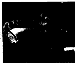
Milch macht's: Sie kann offenbar vor Insulinresistenz schützen.

So lautet das Ergebnis einer Studie US-amerikanischer Forscher mit etwa 3200 Personen im Alter von 18 bis 30 Jahren. Untersucht wurde dabei, wie viele der jungen Erwachsenen innerhalb von zehn Jahren ein metabolisches Syndrom entwickeln. Das metabolische Syndrom mit Insulinresistenz, Adipositas, Hypertonie und Dyslipidämie gilt bekanntlich als Vorstufe eines Typ-2-Diabetes und einer koronaren Herzkrankheit.