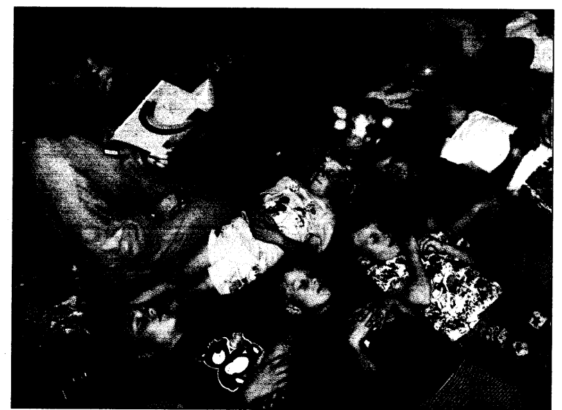
Zwölf Kinder auf einer Märchenreise: Die Betreuerin führt sie durch die

Die KBV will dagegen die Prinzipien des Datenschutzes nicht einfach aufgeben. Montag in zwei Wochen wollen beide Seiten diesen Interessengegensatz am Beispiel einer konkreten Indikation noch einmal durchdeklinieren. Der wahrscheinlich letzte Versuch, die Umsetzung der DMP in einem Bundesmantelvertrag zu regeln.