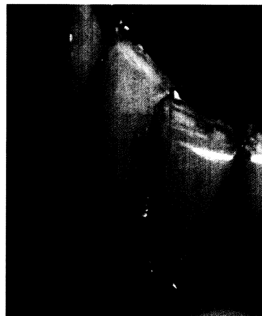
PAR-Therapie – die Kurettage