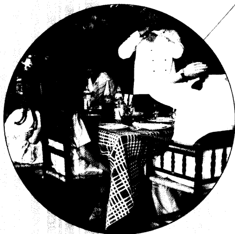
„Der Indianer“, Film von 1987