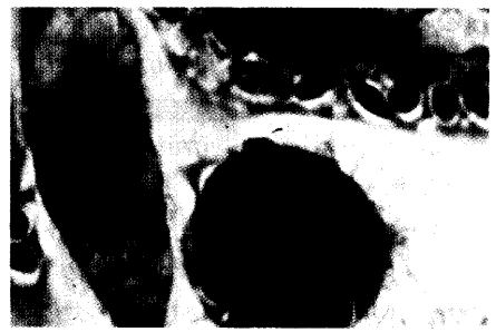
Der Stich der winzigen Sandmücke kann der Beginn einer lebensgefährlichen Erkrankung sein. Die Tropenkrankheit Leishmaniose ist auf dem Vormarsch. Seite 44

60 Hethiter-Ausstellung: Heilen mit Magie und Medizin