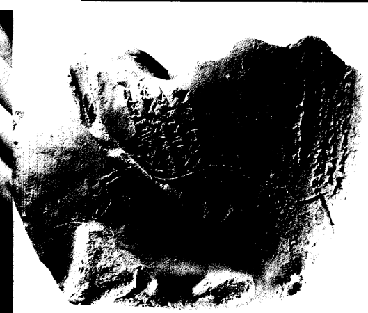
Zwischen Magie und Medizin wandelten die hethitischen Ärzte. Wann es sie in welche Richtung zog, ist unbekannt. Seite 60