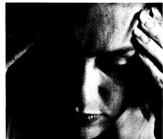
Für die Selbstmedikation bei Schmerzen steht ein weiteres Präparat zur Verfügung. Im März wurde Naproxen-Natrium aus der Verschreibungspflicht entlassen. Seite 28