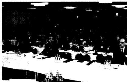
E-Procurement lockt zahlreiche Interessenten

Erfahrungsberichte zeigen: Die ersten E-Procurement-Anwendungen laufen 54