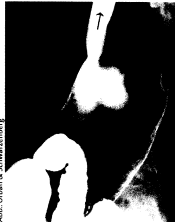
Abb.: Urban & Schwarzenberg