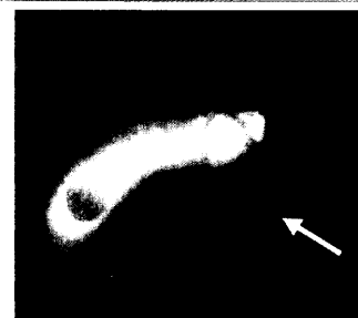
Magnetresonanztomographie-Cholangiographie: präpapilläres Konkrement