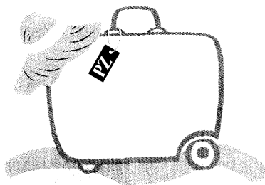
Reisemedizin – in dieser Ausgabe auf Seite 44.

Aromatherapie: Zwischen Esoterik und Arzneimittelrecht