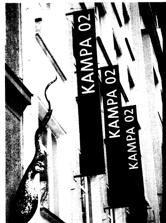
Die Gesundheitspolitik bereitet den Wahlkampfstrategen der SPD Probleme. Der Partei fehlt die einheitliche Linie. Seite 8