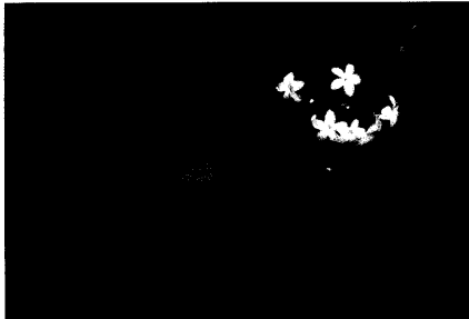
Titelfoto: Rauvolfia serpentina – Schlangenhholz von Margot Spohn