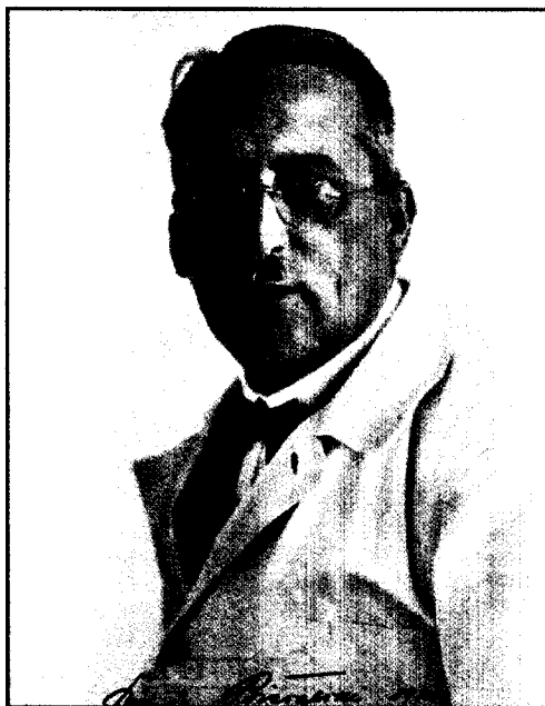
Konrad Biesalski (1868–1930)

Konrad Biesalski und die Anfänge der Rehabilitation der Kriegsgeschädigten im 1. Weltkrieg (S. 96)