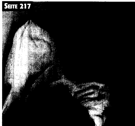
Gesunde Kinder durch Klonen garantieren? Welche Eingriffe in die Natur sind vertretbar?