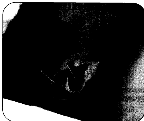
Ohrakupunktur und Klassische Chinesische Körperakupunktur können auch bei Infektionskrankheiten sehr effizient sein. Seite 35