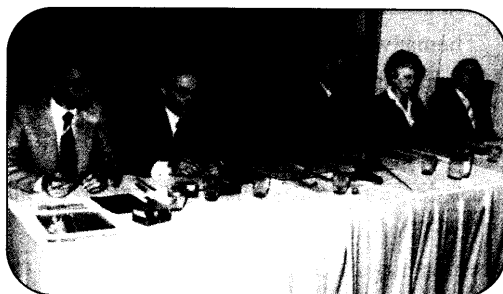
Nach vielen Schwierigkeiten hat sich die Arbeitsgemeinschaft Neuraltherapie in der ehemaligen DDR fest etabliert - hier die 4. Tagung 1980 in Riesa. Seite 38