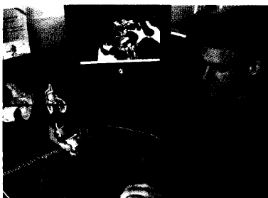
Vom Rachen durch die Speiseröhre in den Magen, von dort aus weiter in den Darm. Das Programm virtusMed ermöglicht Reisen durch den Körper am PC. Seite 81