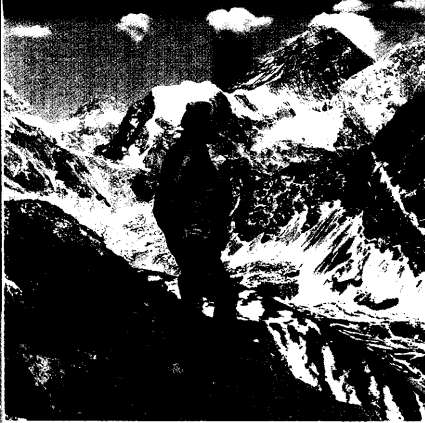
Langsamkeit ist die beste Prävention vor Höhenkrankheit. Die lebensbedrohlichen Symptome sind Resultat zu großer Eile beim Aufstieg. Therapie der Wahl ist der direkte Abstieg. Aber auch Medikamente werden eingesetzt. Seite 69