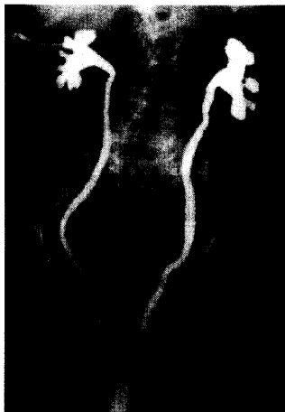
Hydronephrose aufgrund eines Scheidenblindsackvorfalls. Eine Darstellung der Operationsverfahren bei diesem Befund finden Sie ab S. 146