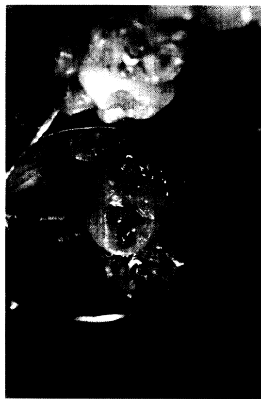
MagicFil – das magische Füllungsmaterial